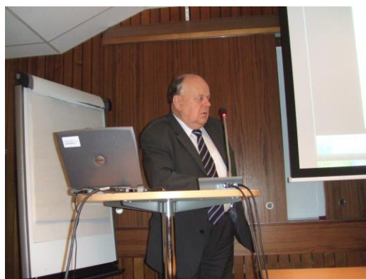
Belarus första statschef Stanislav Sjusjkevitj.