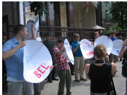
Aktion utanför Vitrysslands ambassad i Kiev.

Den 16:e juni och 16:e juli deltog medlemmar ur Östgruppen tillsammans med ukrainska aktivister i manifestationer till stöd för frihetsrörelsen i Vitryssland utanför den vitryska ambassaden i Kiev.